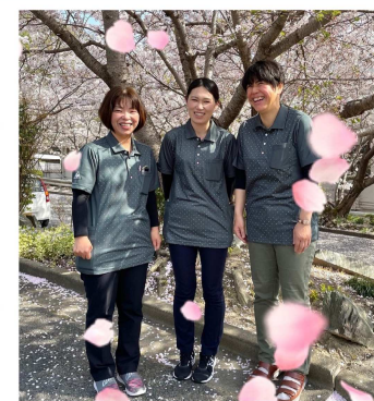
サービス管理責任者 相談支援専門員