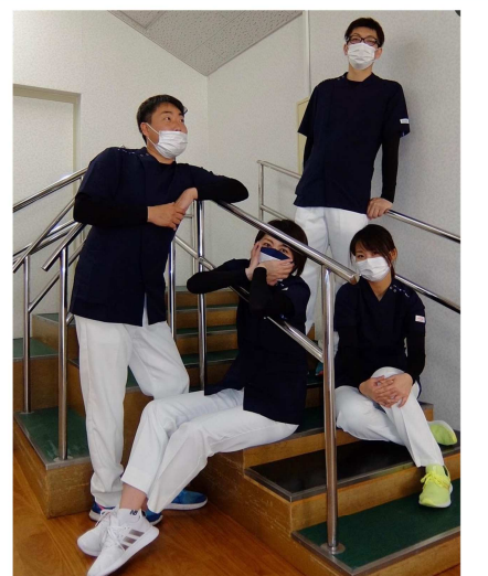
理学療法士 作業療法士