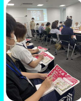
らくスポ会議 利用者さんは リモートで参加

10月1日（土）にたつの市役所周辺にて開催された『らくスポ』に利用者さんと参加してきました。らくスポとはたつの市版ユニバーサルスポーツで様々な団体が集まりいろんな方に楽しんでいただけるスポーツを考え実施しようというイベントです。当施設も利用者さんと一緒に企画会議に参加しました。パラスポーツであるフライングディスクとポッチャをしていただくこととなり、体験ブースを設置しました。当日は天候にも恵まれ、まさにスポーツの秋日和。たくさんの方々と一緒になってスポーツを楽しむことができました。利用者さんをはじめ関係者の方々本当にお疲れさまでした。