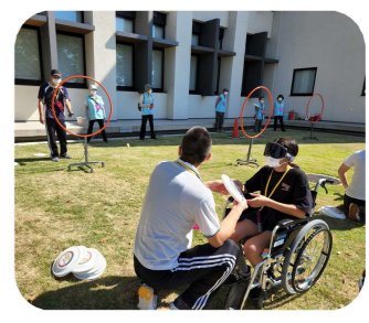
目隠しで挑戦！ 音を頼りにナイススロー！