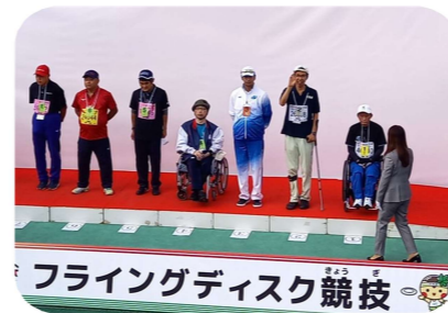
あと一步メダルには届きませんでしたが好記録を残されました