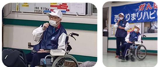
橋本さんから気合のこもった挨拶