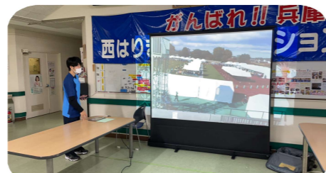
当日はLIVE観戦し、館内からも応援しました