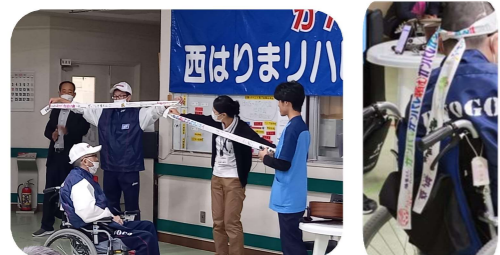
職員一同から応援メッセージ付きハチマキを贈呈