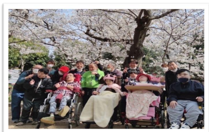
4月 網引公園にて 生活介護のご利用者の方々がドリーム甲子園の近 くにある公園に花見に行かれました。 桜が満開の中、職員も一緒に皆んなで公園の遊具 で遊びました。