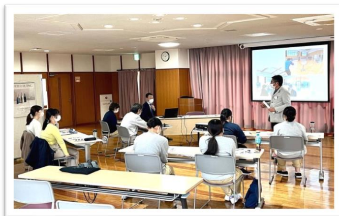
4月4～7日 シルバーコースト甲子園にて たつのと西宮に分かれて、新人職員研修を開催し ました。理事長・事務局長をはじめ役職員が講義を 行い、福祉職員として従事するための知識を学びま した。