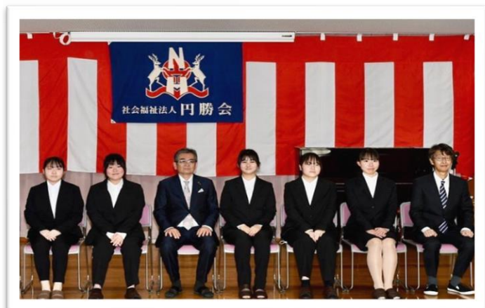
4月3日 シルバーコースト甲子園にて 感染症対策のため、たつのと西宮に分かれて、入 社式と昇任者の辞令交付式を開催しました。