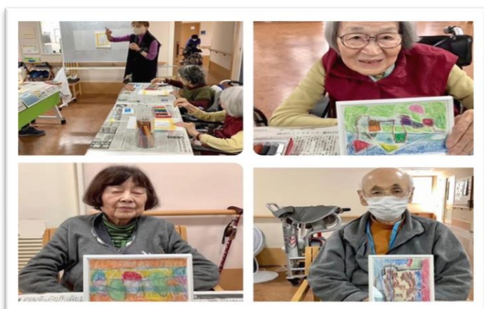
4月 第2シルバーコースト甲子園にて 円勝会では、法人所属の臨床美術士が各施設で 定期的に臨床美術（クリニカルアート）を行って います。興味のある方は、Instagramで『円勝会 りんびくらぶ』と検索してみてください。