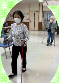
ノルディック歩行