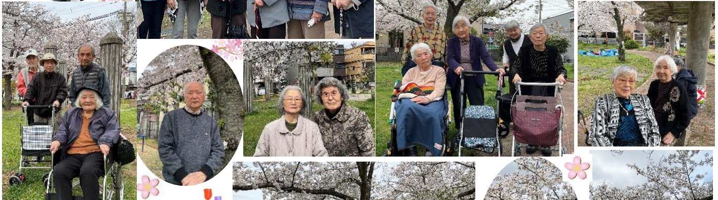
施設内の桜・チューリップ咲きました