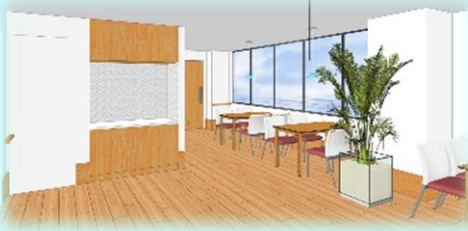
ダイニングスペース