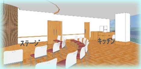
交流スペースとオープンキッチン