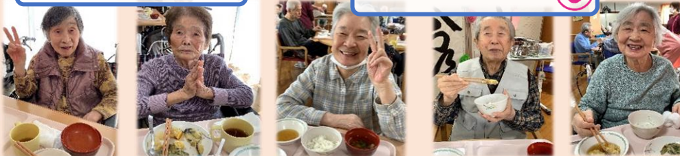
笑顔がたくさん見られました😊