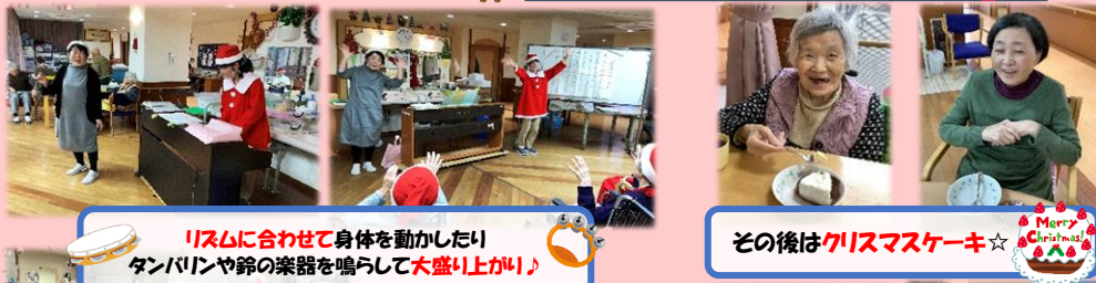
リズムに合わせて身体を動かしたり タンバリンや鈴の楽器を鳴らして大盛り上がり♪