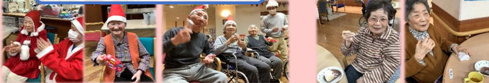
その後はクリスマスケーキ☆