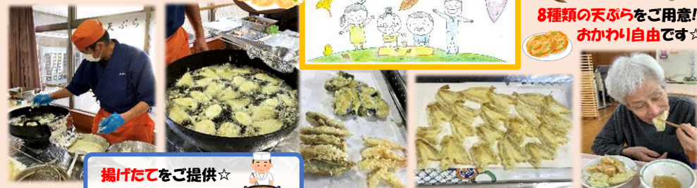
揚げたてをご提供☆