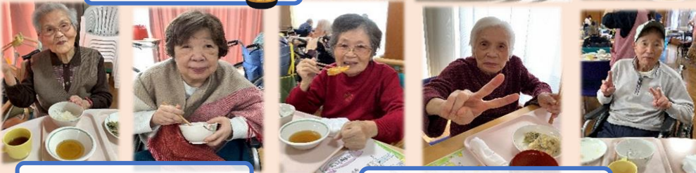
「美味しい」と大好評♪